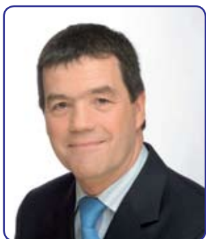
Noel Dempsey, T.D. Aire Iompair

Ceanglaíonn seirbhísí muiriompair paisinéirí Éire le tíortha comharsanacha agus soláthraíonn siad seirbhísí rialta go dtí na hoileáin amach ón gcósta, do dhaoine áitiúla agus do chuirteoirí araon. Tá siad tábhachtach maidir le tuarasóireacht agus meas ar ár saol cultúrtha a chothú trí aistir agus thurais aeraíochta mhuirí. Tá na treoirlínte seo dírithe ar inbhuanaitheacht na príomhearnála seo a mhéadú agus ar chuidiú le rochtain ar an earnáil seo a sholáthar do i bhfad níos mó daoine chun go mbainfidís taitheamh aisti.